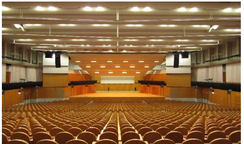
設計：佐藤総合計画