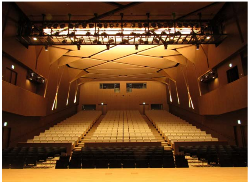
設計：石本建築事務所

客席照明など客席天井に取付くものは露出型シーリング投光部の下面に集中させて、本来の客席天井には器具類の設置を避けるようにし、スッキリとした天井を目指しながら、かつ保守の容易なあり方を実現しました。この手法は既にいくつかの事例で経験していたので、積極的に今回は客席照明は反射光に挑戦しました。