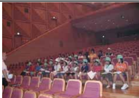
写真 - エトピアおおの

この施設が開館した頃は豊後大野市ではなく、大野郡の8町村が結集してプロジェクトが進んできました。エトピアという愛称はそこから付いたものです。地元で演劇活動を活発に行っている高校生のデモから始まった楽しい探検隊は子供達の笑顔で一杯でした。